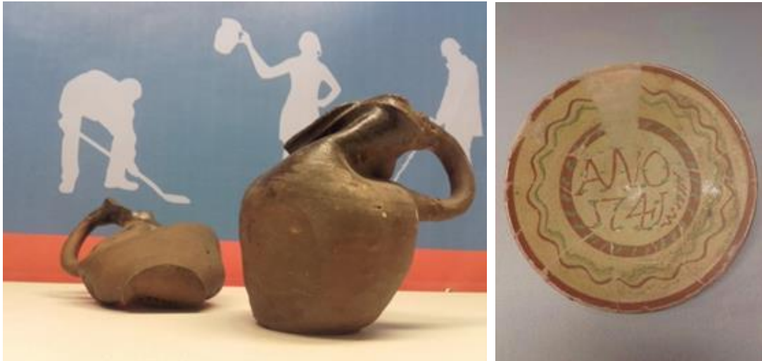
Pottenbakkersafval uit de collectie Jan Goorhuis: misbaksels van kannen en gedateerd bord.

Wellicht ontstaat duidelijkheid of de pottenbakkersproducten uit Winterswijk voor een lokale of juist meer een bovenregionale markt zijn geproduceerd en wat de verspreiding van dit soort aardewerk is geweest.